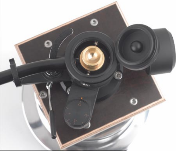
Die Ölwanne der Dämpfungseinrichtung sitzt fest auf dem Armschaft, dort taucht ein „Paddel“ unter dem Schraubdeckel ein

Neunzöller. Der diesbezügliche Unterschied zum Zwölfzöller ist nicht mehr so groß, dafür passt ein „Zehnfünfer“ in vielen Fällen noch auf ein normal breites Laufwerk. Der Montageabstand, also die Entfernung zwischen Plattentellerachse und Tonarmdrehpunkt beträgt bei DFA 105 251 Millimeter, die Frage nach der Herkunft der Typenbezeichnung dürfte damit auch geklärt sein.