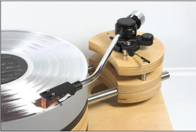
Optional gibt's den Feickert auch mit poliertem Armrohr, hier auf einem hauseigenen Laufwerk montiert

preis würde ich mir gönnen, legt der DFA derart angeleint doch dynamisch deutlich zu, die gesamte Präsentation gerät merklich zackiger und pointierter. Da fehlt eigentlich nichts mehr, das geschmackliche Abstimmen einer Kette auf dieser Basis beschränkt sich dann auf die Auswahl eines passenden Tonabnehmers. Womit es dem DFA 105 in Summe ein exzellentes Zeugnis auszustellen gilt: Er ist nicht weniger als eine praktisch fehlerfreie Konstruktion.