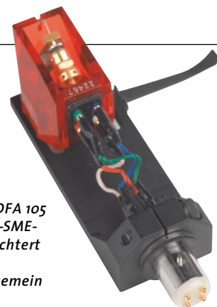
Das Headshell des DFA 105 hat einen Standard-SME-Anschluss. Das erleichtert den Einbau von Tonabnehmern ungemain

Und so durfte der DFA letztlich seinen Platz auf dem Transrotor Fat Bob einnehmen, eine Linn-kompatible Basis dafür war ohnehin vorhanden. Was schraubt man in einen Arm dieser Kategorie für einen Abtaster? Klar – im Zweifelsfall das „unvermeidliche“