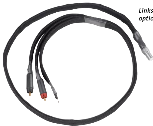
Links: Das Bessere ist des Guten Feind – mit dem optionalen TMR Ramses hebt der Arm klanglich ab

und freier. In Einzelfällen, wenn etwa die Resonanzfrequenz der Arm-/Systemkombi in einem ungesunden Bereich zu liegen kommt, kann die Vorrichtung durchaus segensreich sein.