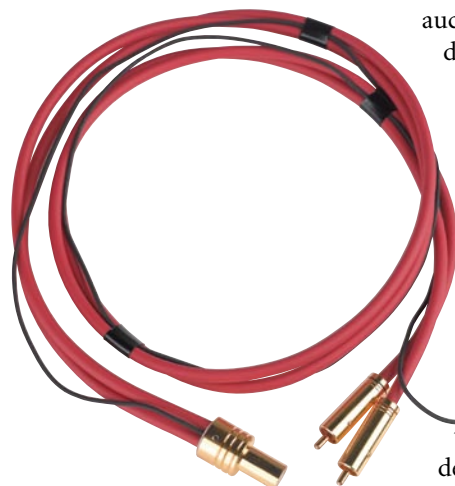
Oben: Dieses wahrlich nicht schlechte Tonarmkabel gehört zur Standardausstattung des DFA 105